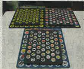
脳トレ「よーし！おくぞー！」。ご当地クイズ(前列)、さかなへん(後列左)、国旗あてクイズ(同右)

ルールは簡単。ボードに描かれている漢字や絵柄に合わせ、それと同じ駒を置いていくだけ(駒の裏にはよみかなや答え)。19年3月に、さかなへん(鮪・鯨などの漢字)、花・野菜・果物(チューリップ・バナナなどの絵)、国旗あてクイズ(日の丸などの絵柄)の3種類を発売。20年