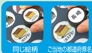
同じ絵柄 ご当地の都道府県名